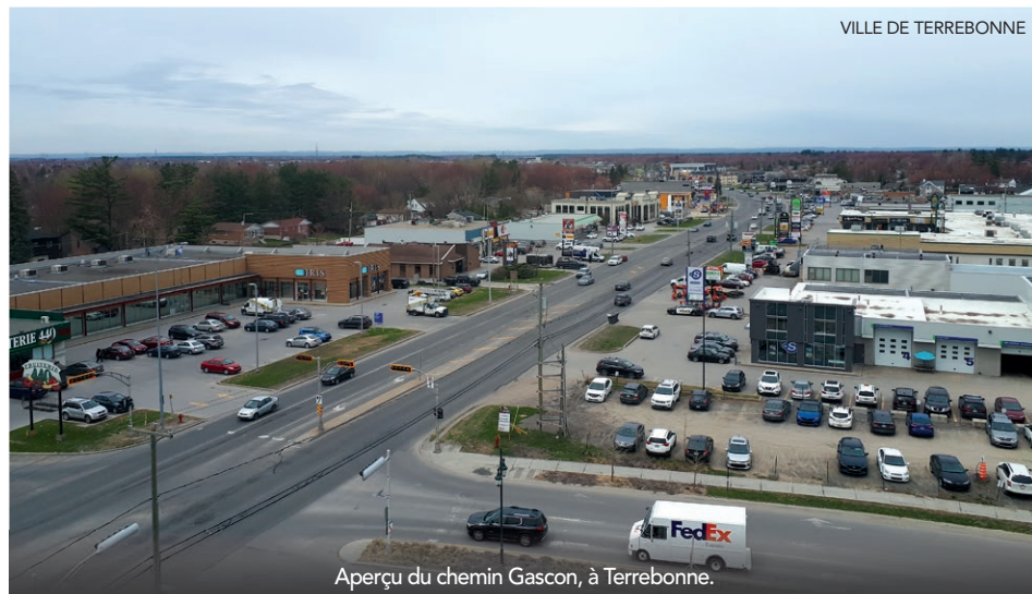
Aperçu du chemin Gascon, à Terrebonne.

En outre, pour satisfaire Hydro-Québec, qui veille sur sa ligne à haute tension passant au-dessus du chemin Gascon, des bollards